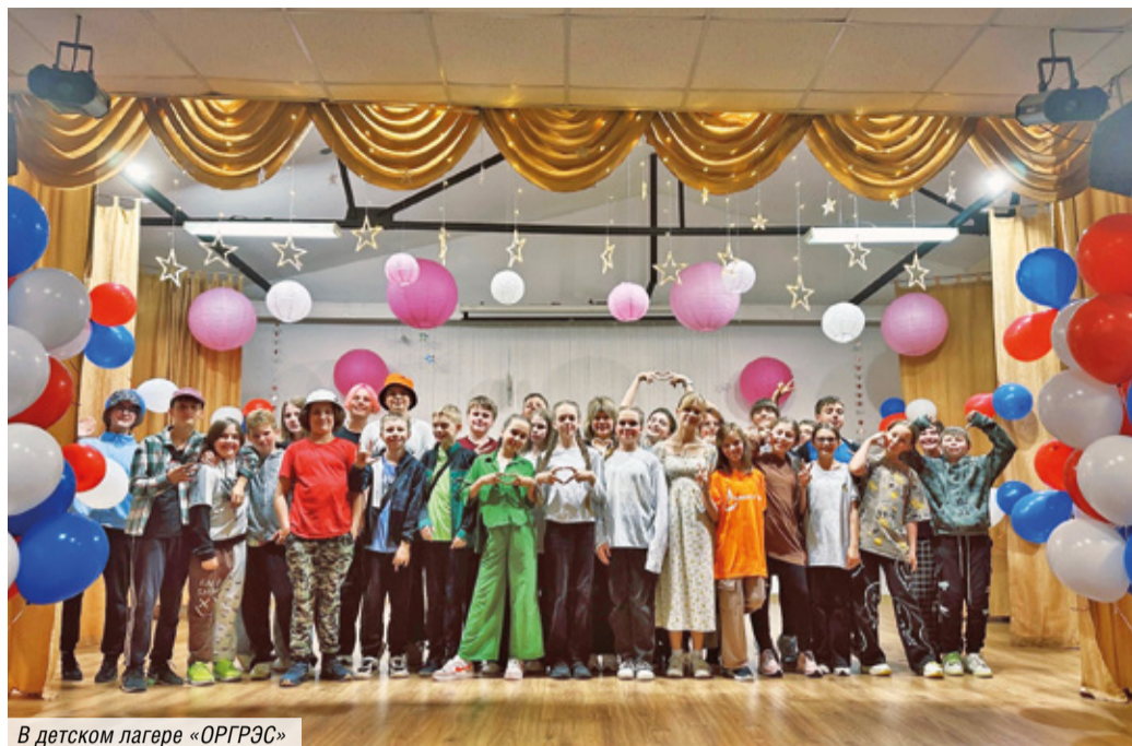
В детском лагере «ОРГЭС»