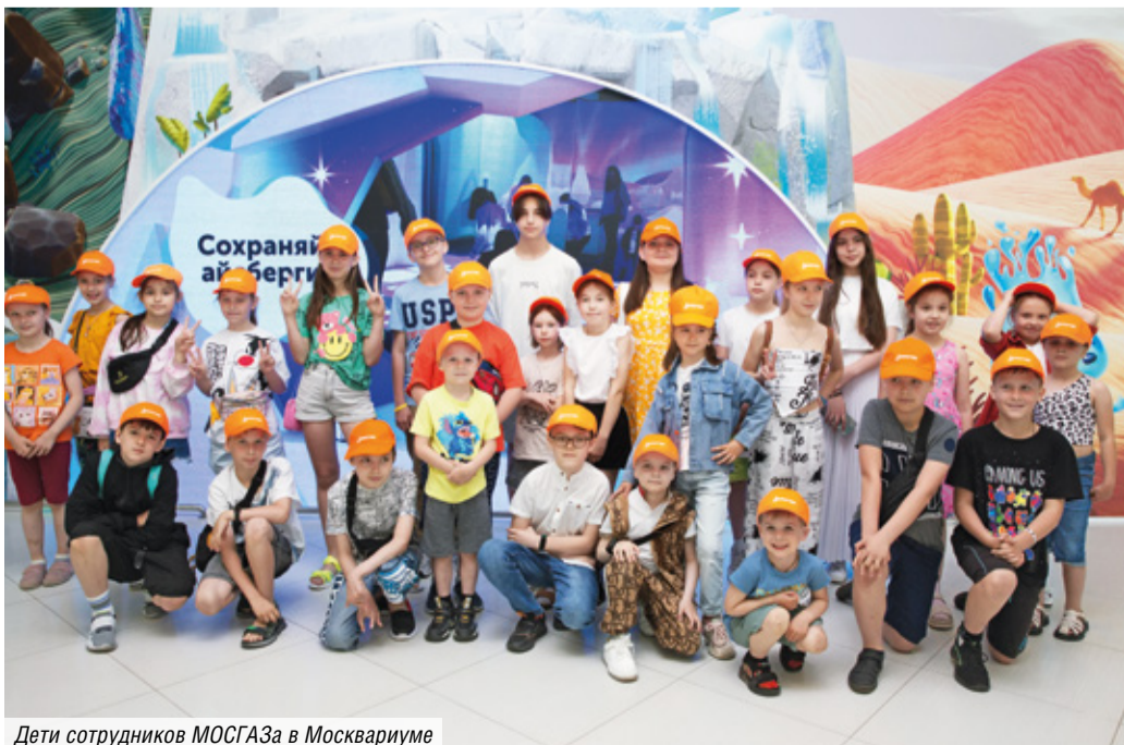
Дети сотрудников МОСГАЗа в Москвариуме

Поддержка подрастающего поколения — один из ключевых приоритетов МОСГАЗа, социальные программы компании направлены на помощь многодетным семьям и развитие творчества юных. Мы стараемся, чтобы каждое лето стало незабываемым для наших сыновей и дочерей.