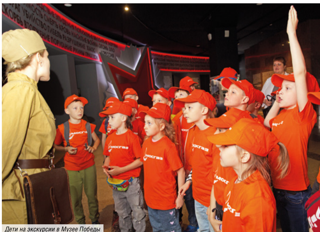
Дети на экскурсии в Музее Победы

было отработано Управлением аварийно-восстановительных работ по газоснабжению