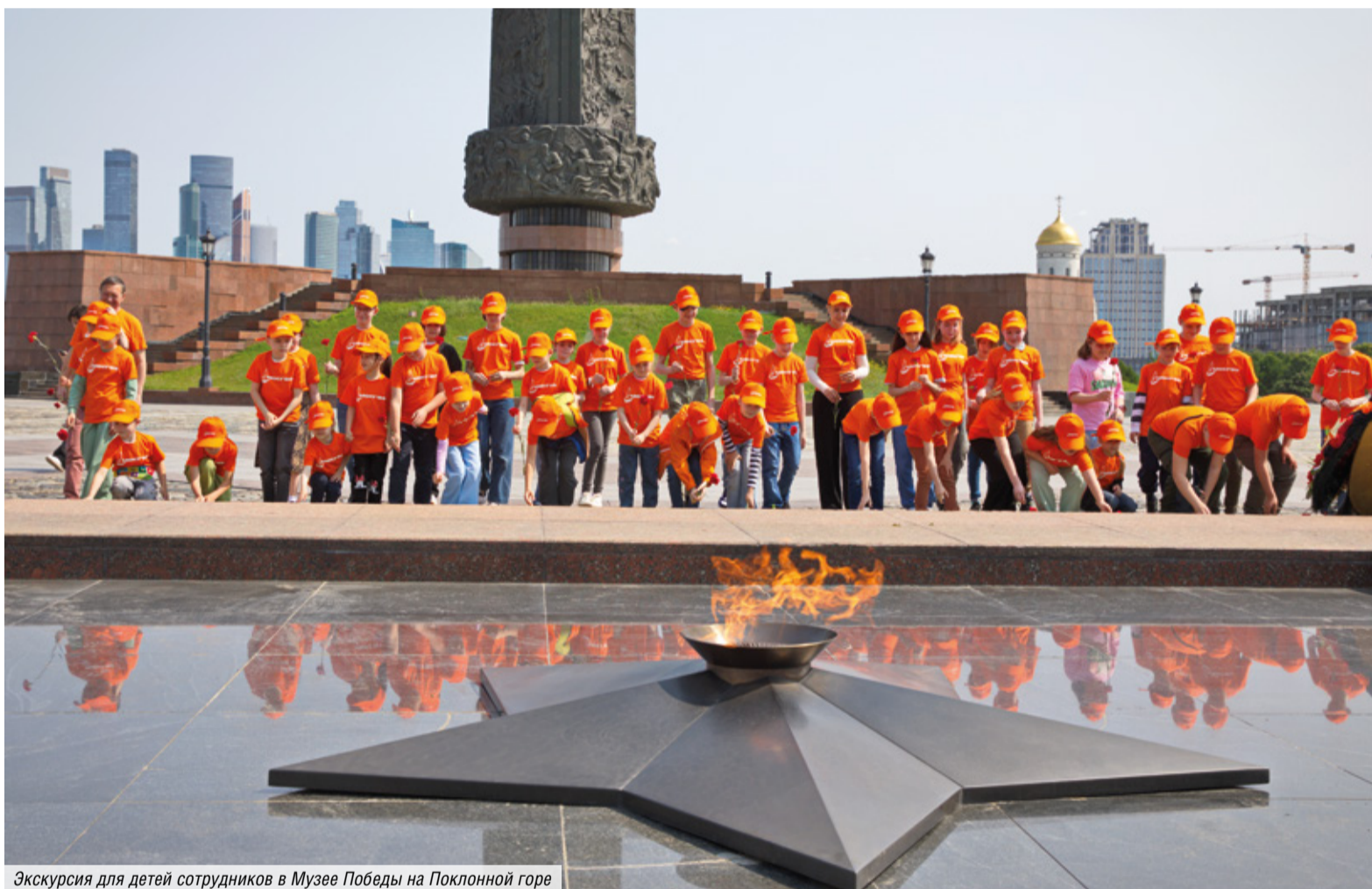
Экскурсия для детей сотрудников в Музее Победы на Поклонной горе

КАК ДЕТИ МОСГАЗОВЦЕВ ПРОВЕДУТ ЛУЧШИЕ 92 ДНЯ В ГОДУ