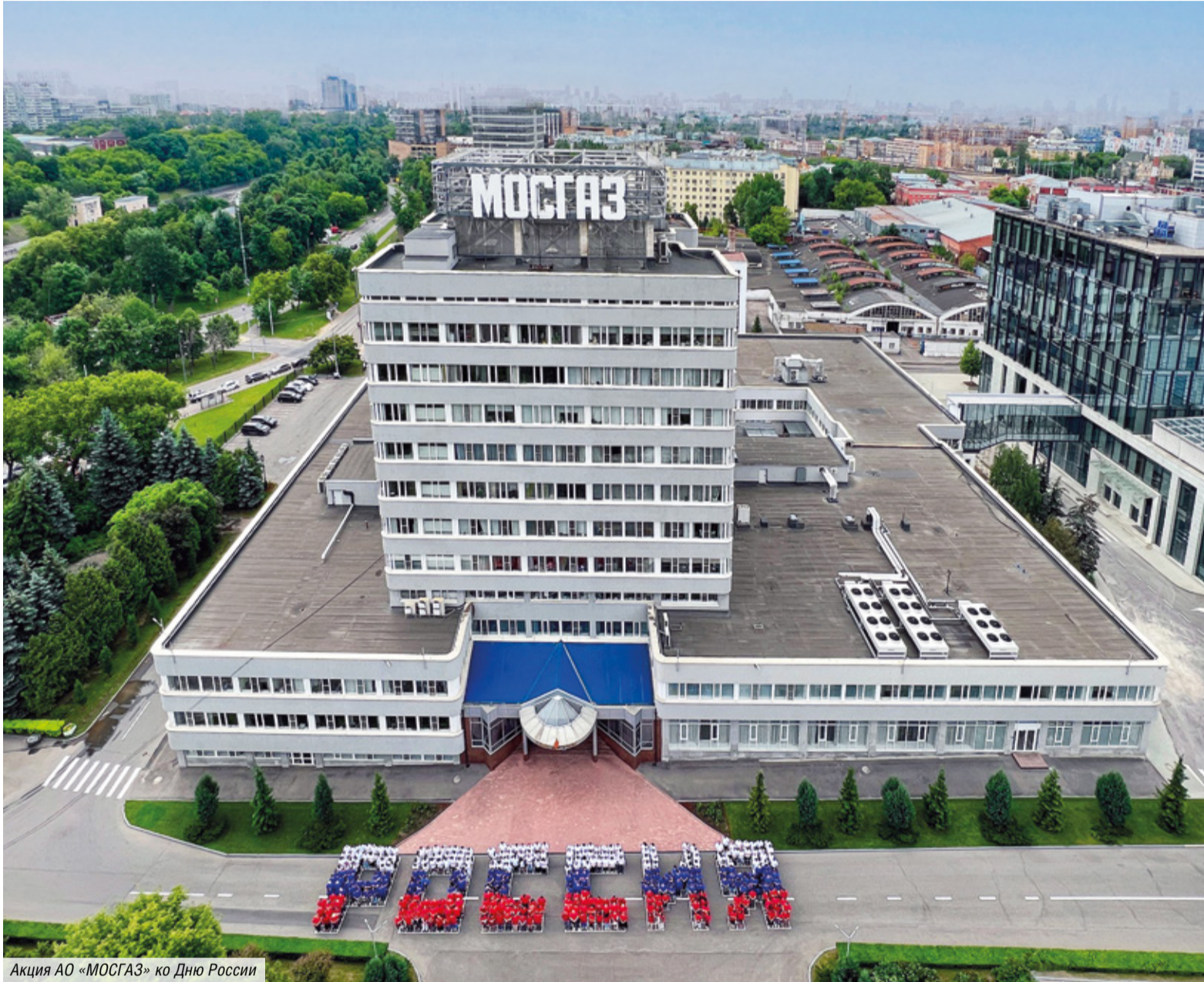
Акция АО «МОСГАЗ» ко Дню России