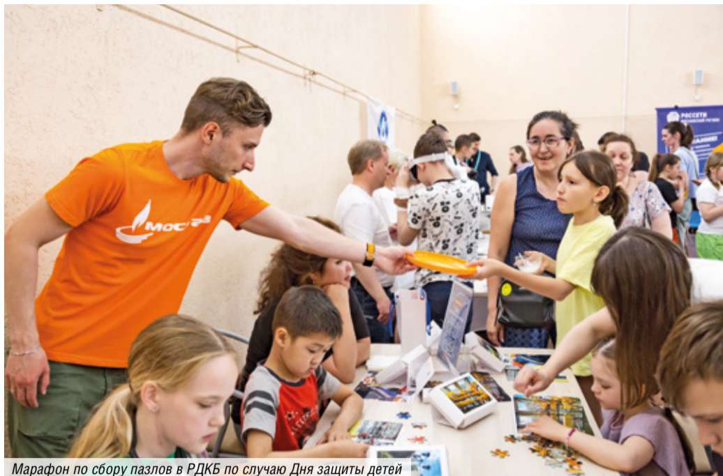
Марафон по сбору пазлов в РДКБ по случаю Дня защиты детей